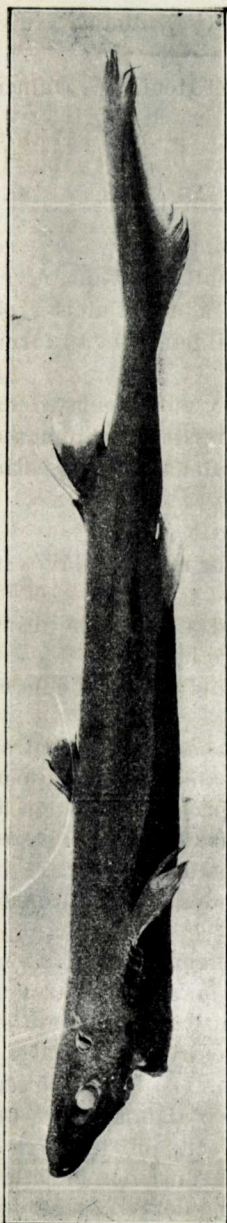
Spinax niger Hip. Cloquet